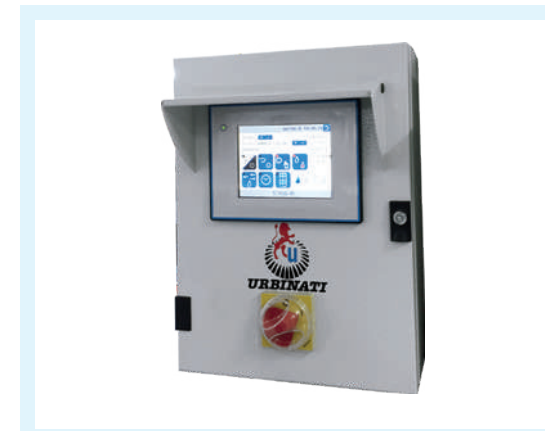
Cuadro de control de acero inox AISI 430 pintado con pantalla táctil. Puede ser controlado desde remoto con PC o a través de conexión RS 485.