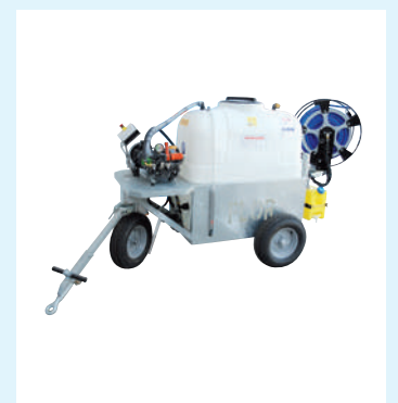
Bomba de alta presión con ruedas, para tratamientos fitosanitarios y aspiración del líquido residual.