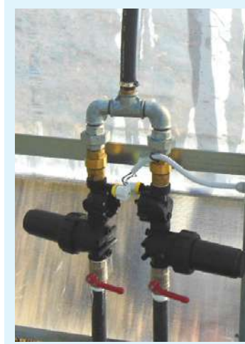
Doble unidad de alimentación: válvula de bola, filtro de malla y electroválvula.