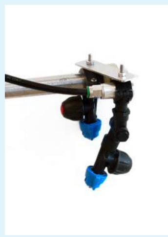
Boquilla de articulación independiente , con válvula para el riego de bordes.