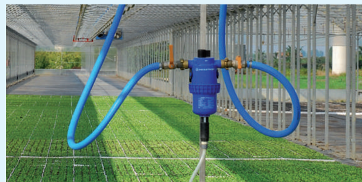
Dosificador proporcional aplicado directamente en la barra de riego.