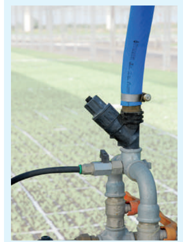
Unidad de distribución agua con válvulas para boquillas laterales y presóstato.