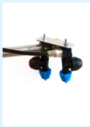
Boquilla independiente con válvula para el riego de bordes.

Nuestro departamento técnico se encuentra a disposición para aconsejarles el accesorio más adecuado a sus necesidades.